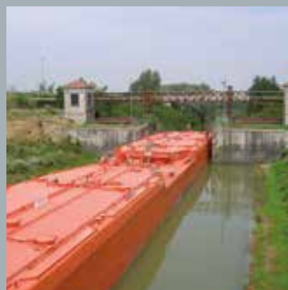
Gestione delle vie navigabili interne