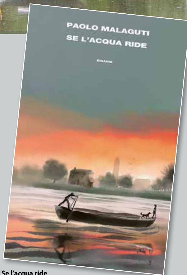
Se l'acqua ride di Paolo Malaguti

2021, Casa Editrice Einaudi - pagg. 185 - € 18,50