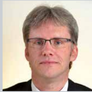
Gianpaolo Bottacin - Veneto