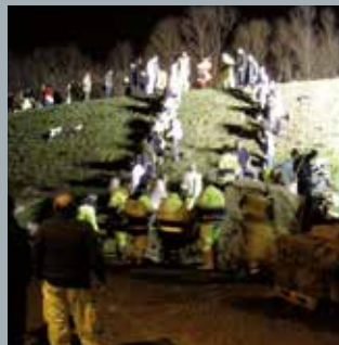
Servizio di piena, previsioni e monitoraggio Polizia idraulica