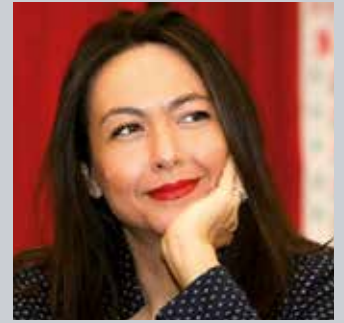
Irene Priolo - Emilia-Romagna