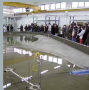
Progetti e studi di laboratorio Mobilità dolce