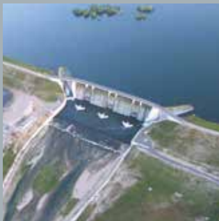
Interventi per la difesa idraulica del territorio e il bilancio idrico