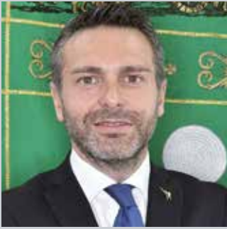
Pietro Foroni - Lombardia