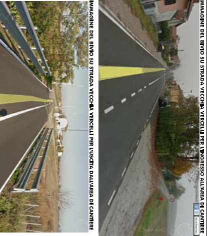
IMMAGINE DEL BIVIO SU STRADA VECCHIA VERCELLI PER L'INGRESSO ALL'AREA DI CANTIERE

APRIL PROGETTO AL E 1775 LAVORI DI ARRETTAMENTO ARGINE IN SINISTRA OROGRAFICA DEL Fiume PO IN LOCALITA' CASINA CONSOLATA DEL COMUNE DI CASALE MONFERRATO PIANO DI SICUREZZA E COORDINAMENTO