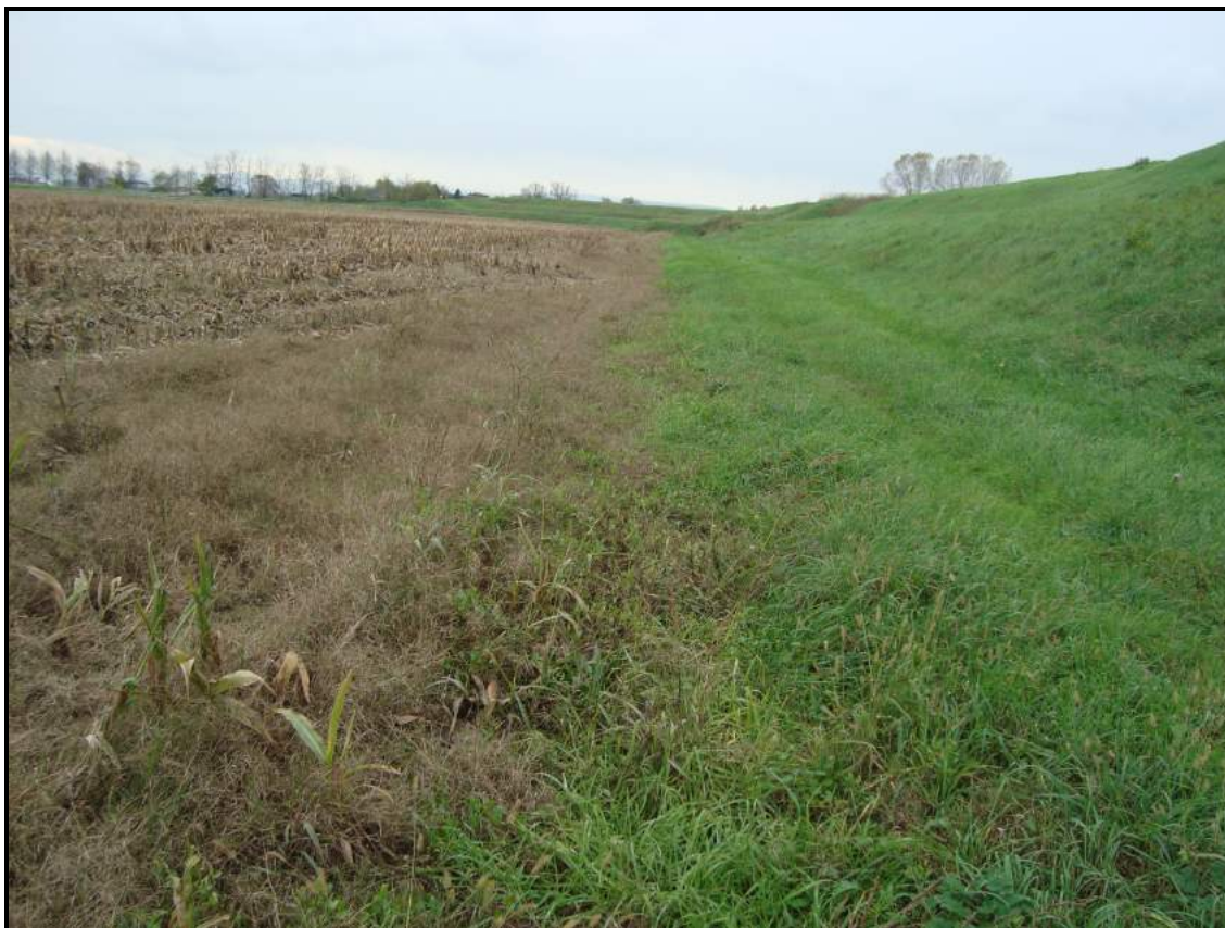
Lato campagna – foto 3