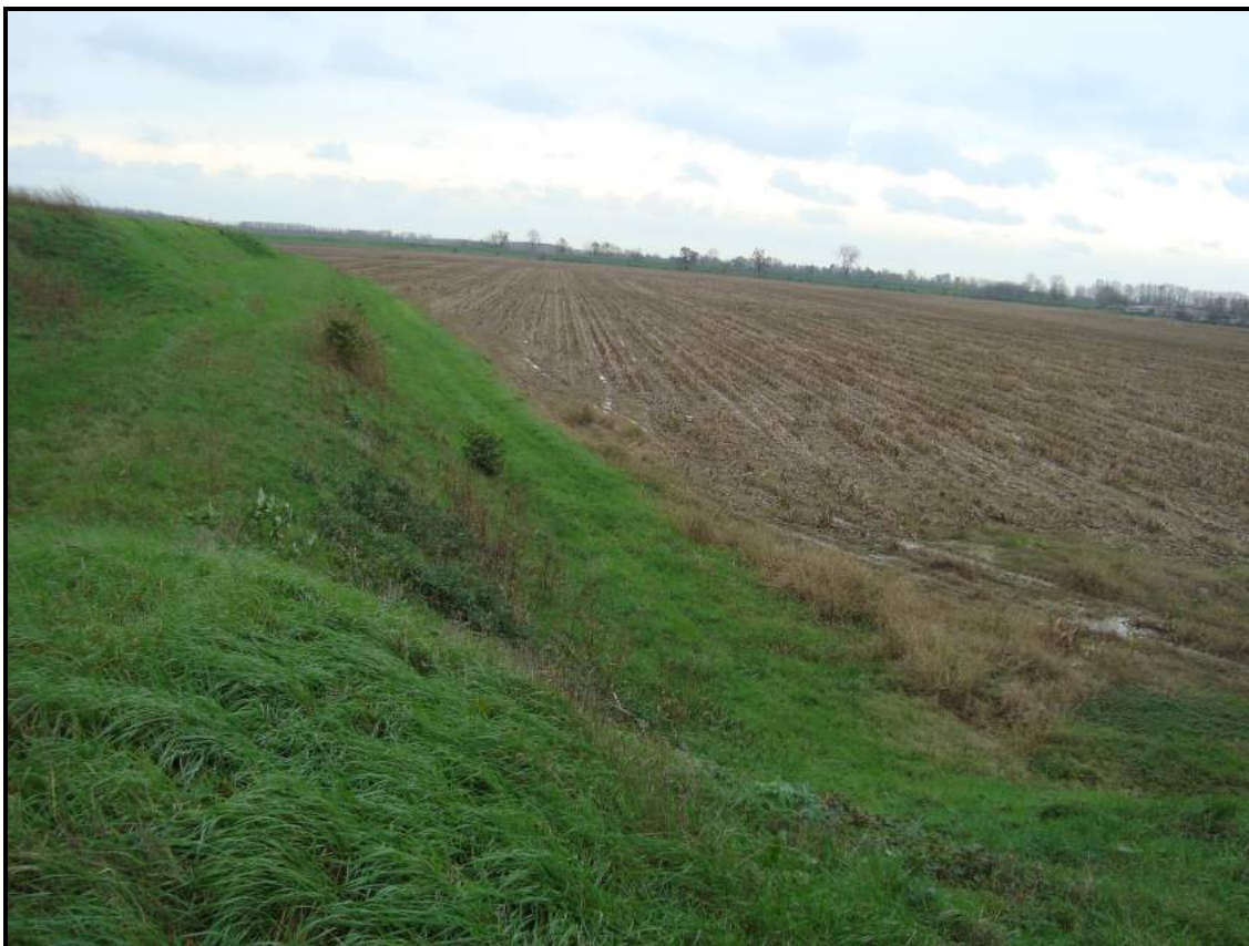
Lato campagna – Foto 1