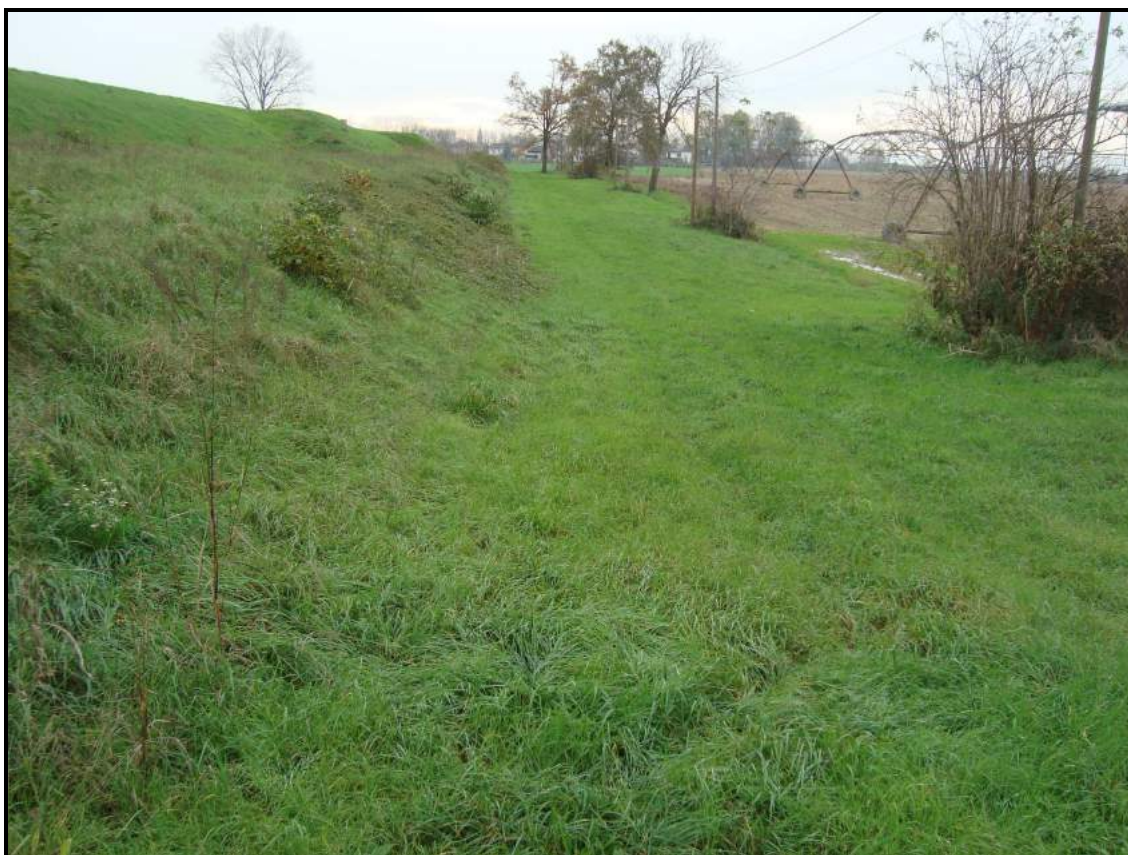
Lato campagna – foto 4