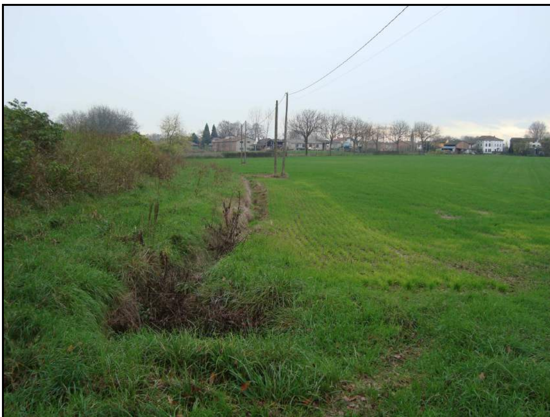
Lato campagna – foto 6