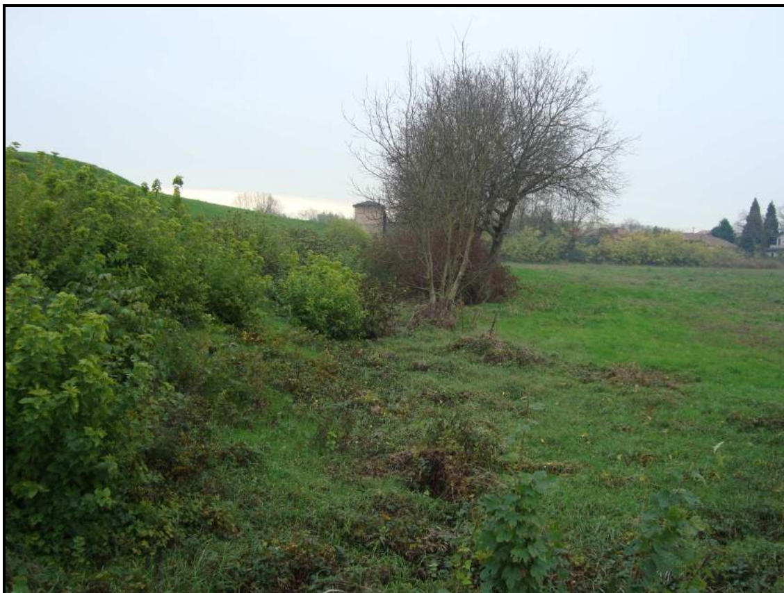
Lato campagna – foto 7