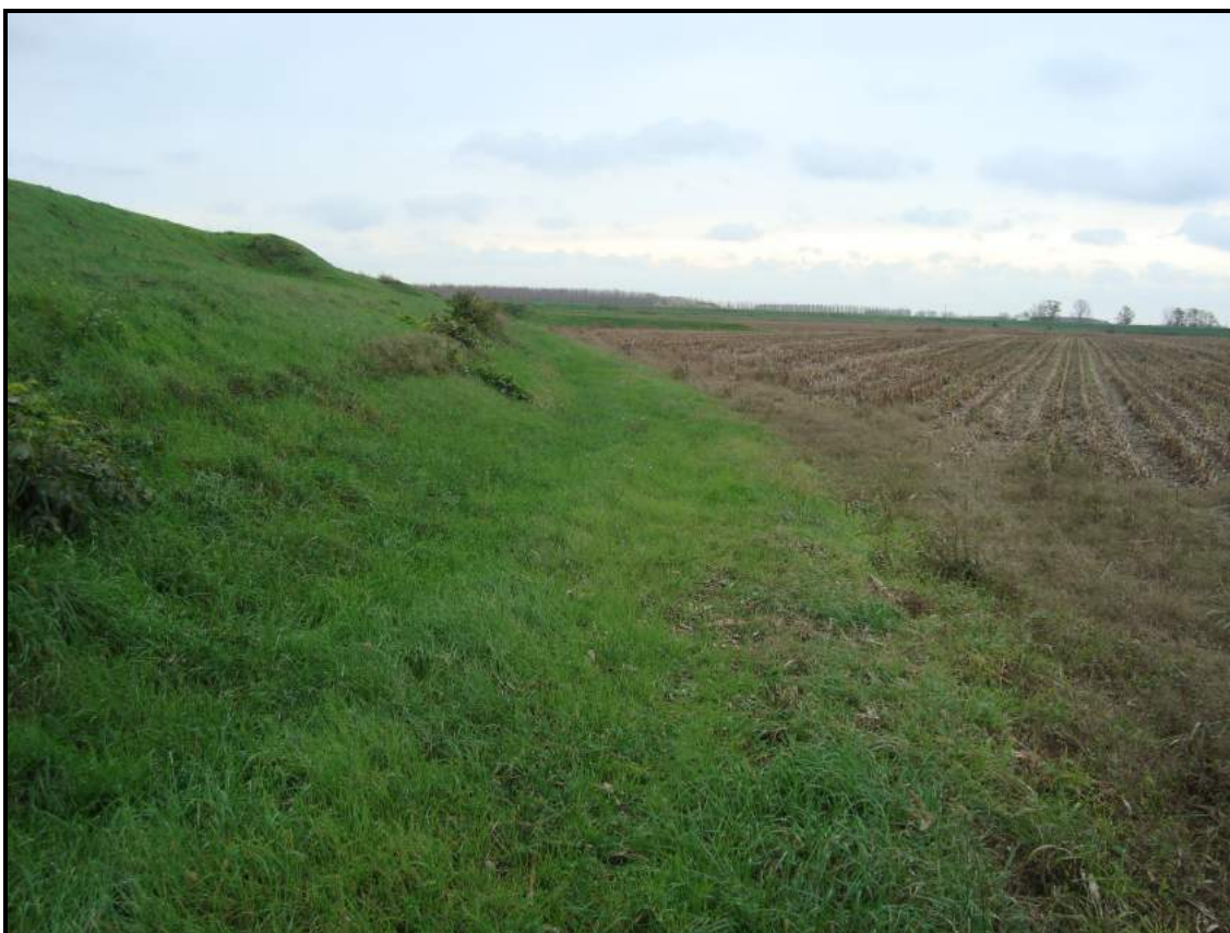
Lato campagna foto 2