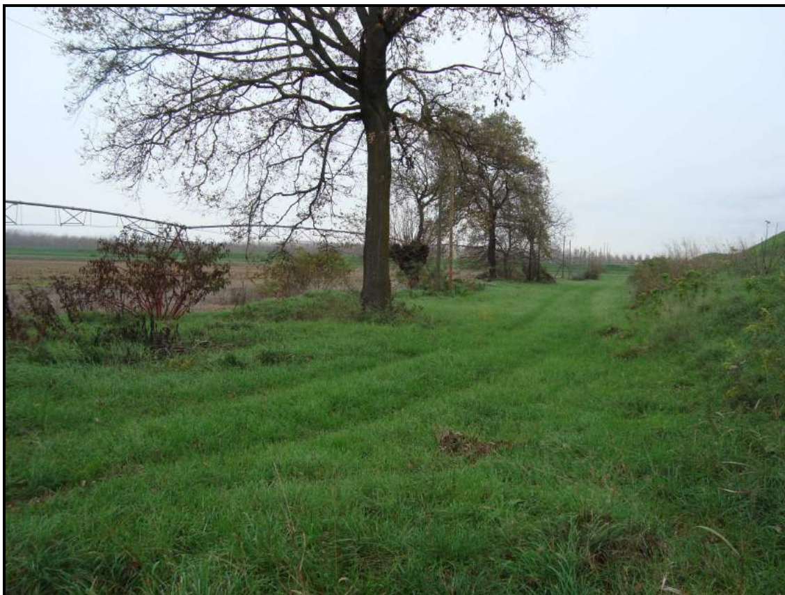
Lato campagna – foto 5