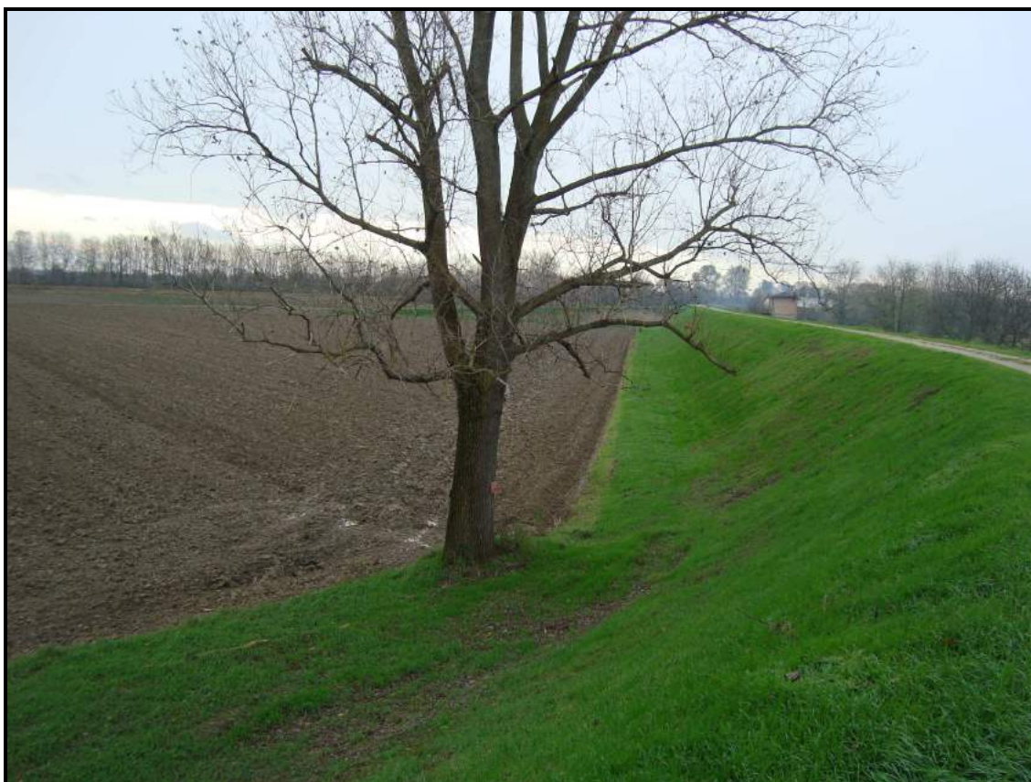
Lato fiume – foto 8