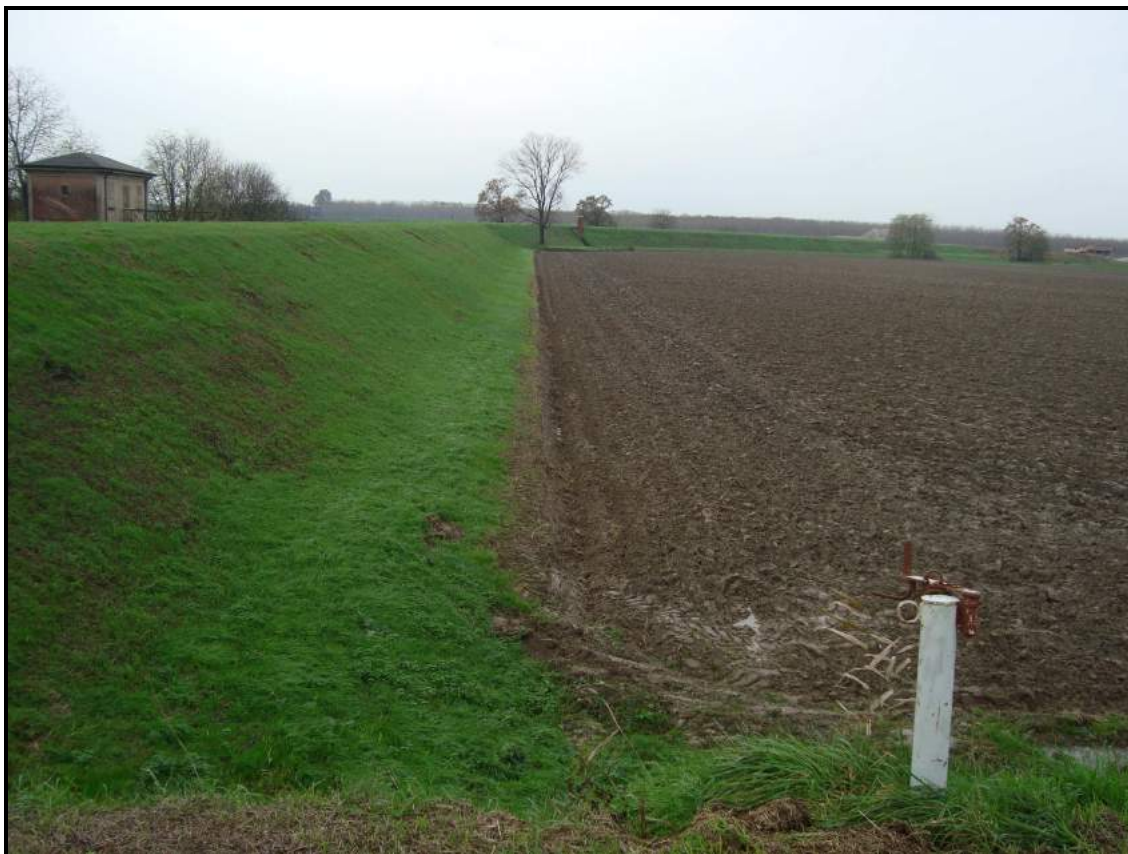
Lato fiume – foto 9