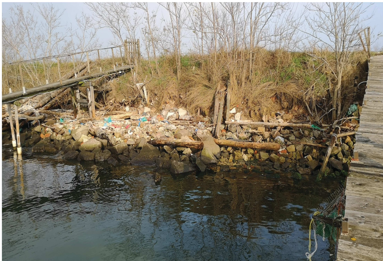
TRATTO CON SCARPATA EROSA