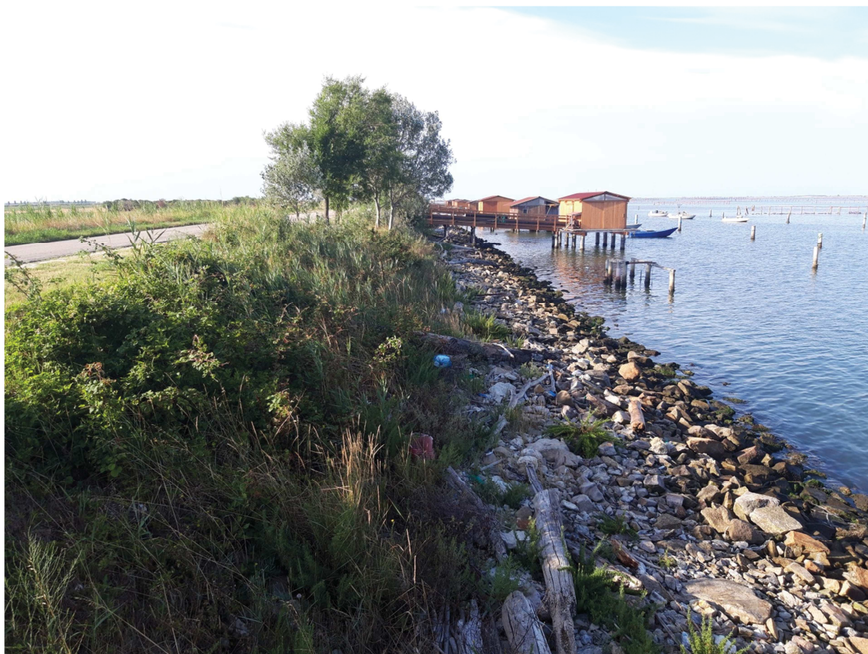
Vista verso monte