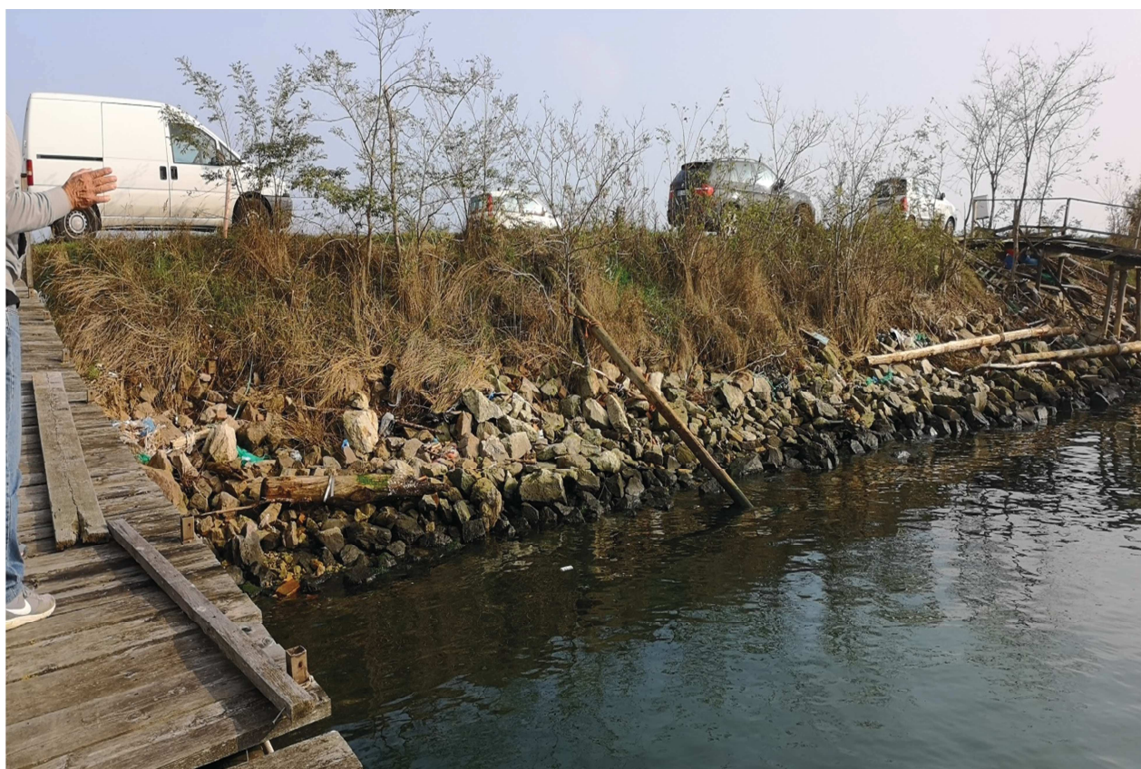
TRATTO CON SCARPATA EROSA