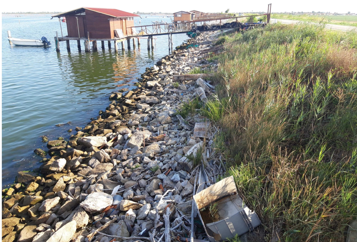
Vista verso valle