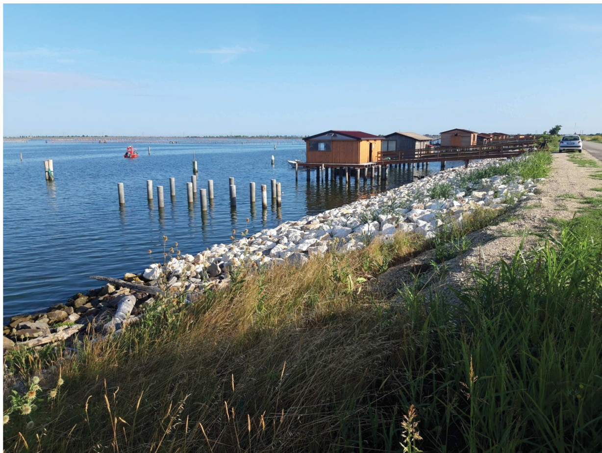
(vista verso valle – direzione Santa Giulia)

TRATTO A VALLE ST. 34 GIA' REALIZZATO CON CUI SI ANDRA' A RACCORDARE L'INTERVENTO PREVISTO IN PERIZIA