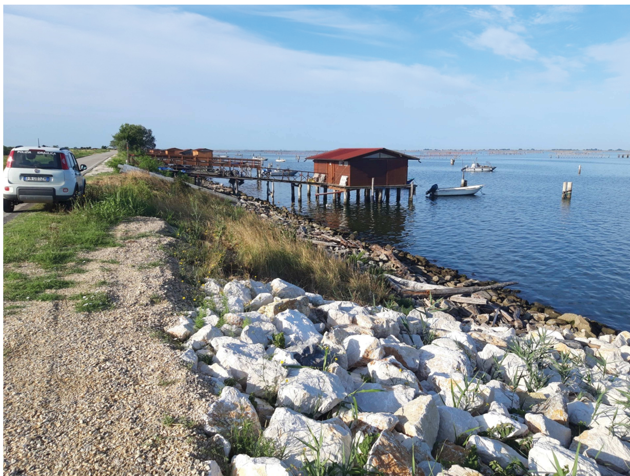
(vista verso monte – direzione Barricata)