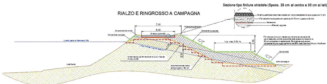
Considerato che nel precedente PC-E-810 lo strato finale stradale è costituito da stabilizzato, visto che tutta la sommità arginale esistente, al di fuori dell'intervento sopracitato, si presenta asfaltata, il presente progetto prevede la asfaltatura in conglomerato bituminoso di tutto il tratto sommitale di rilevato arginale.

Considerata l'importanza strategica che l'arginatura maestra di 2^ categoria del fiume Po riveste per la sicurezza idraulica dell'intero territorio della Provincia di Piacenza, risulta di estremo interesse, per il territorio predetto e per le popolazioni residenti, il mantenimento della completa e piena efficienza dell'arginatura in argomento (e in generale di tutte le opere idrauliche di difesa). Allo stesso tempo l'arginatura maestra in oggetto costituisce un nevralgico punto di passaggio di cicloturisti che si muovono fra le provincie di Cremona, Piacenza e Parma.