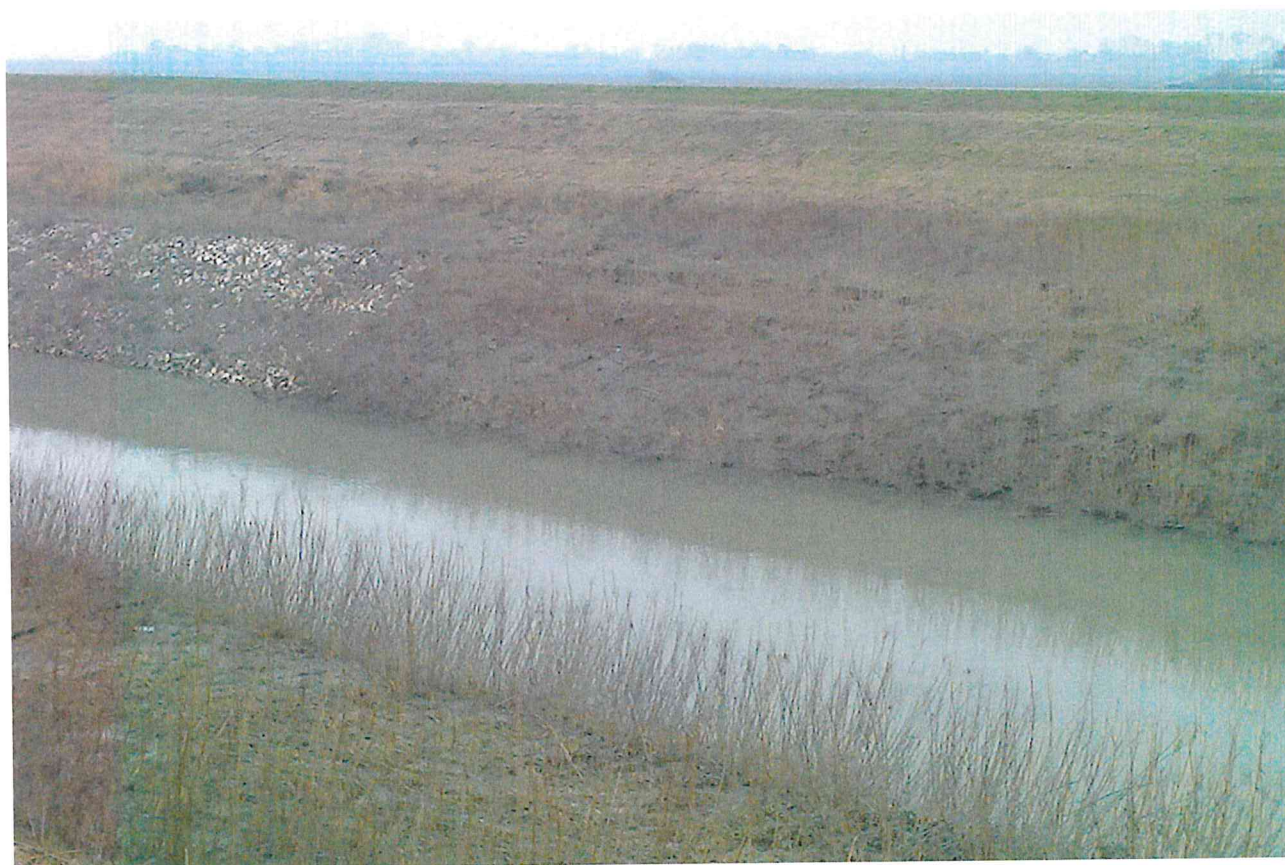
sponda in frana – vista da valle