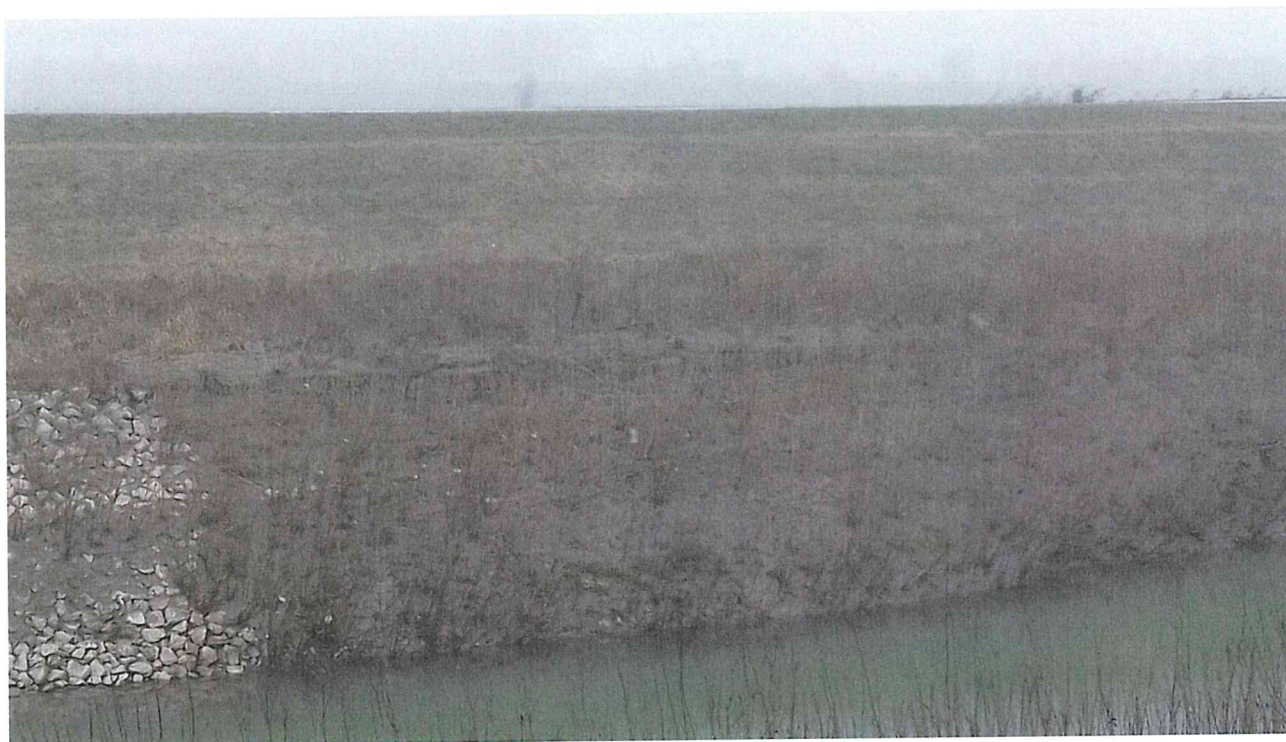
sponda in frana – vista da monte