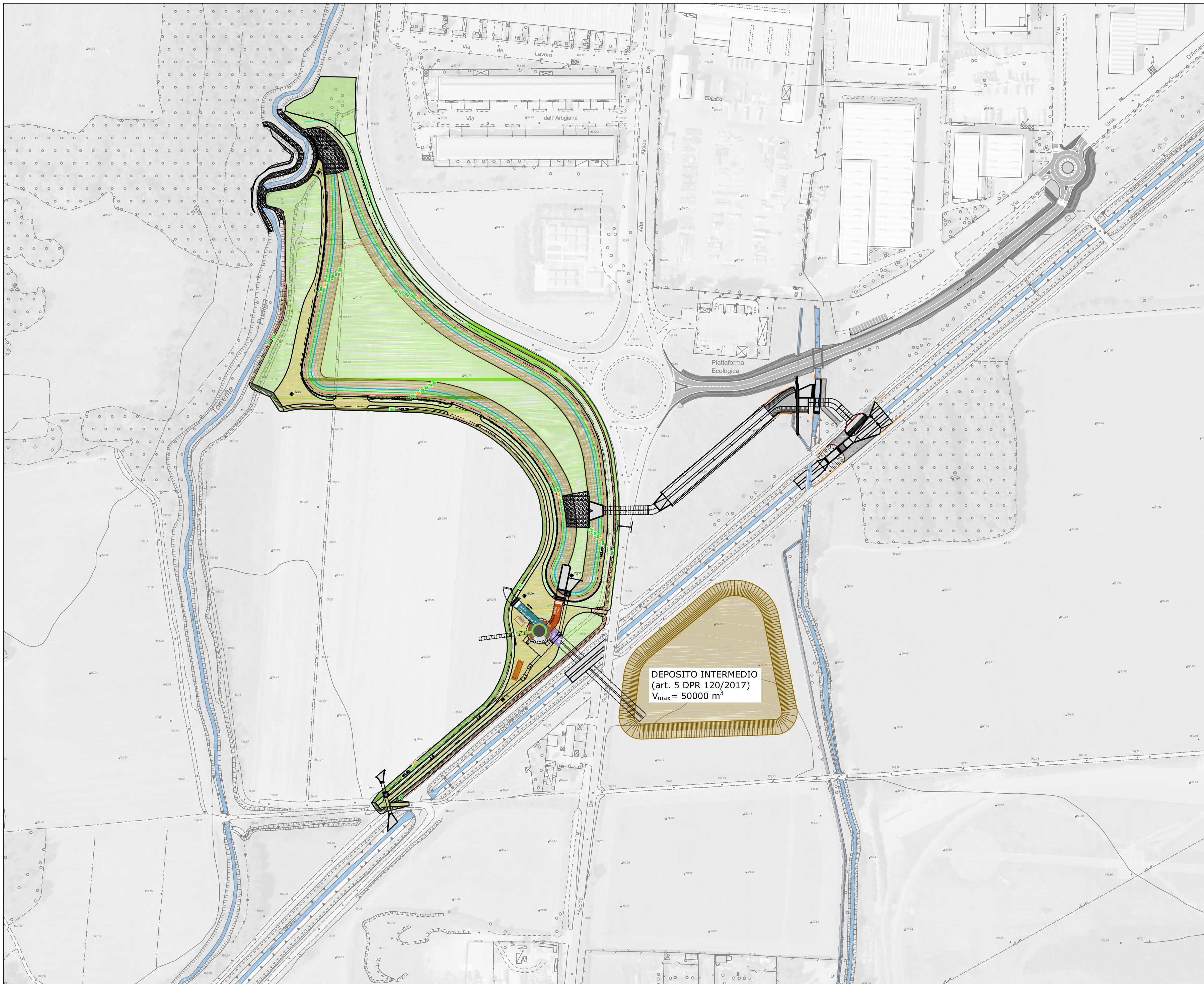
PLANIMETRIA DI INSIEME CON INDICAZIONE DEL SITO DI PRODUZIONE E DEI DEPOSITI INTERMEDI SU BASE ORTOFOTO - II STRALCIO