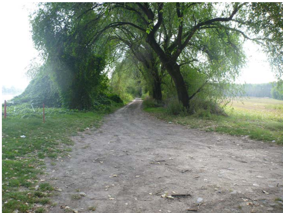
Foto 2: Pista per accesso all'area d'intervento (via alzaia di Po)