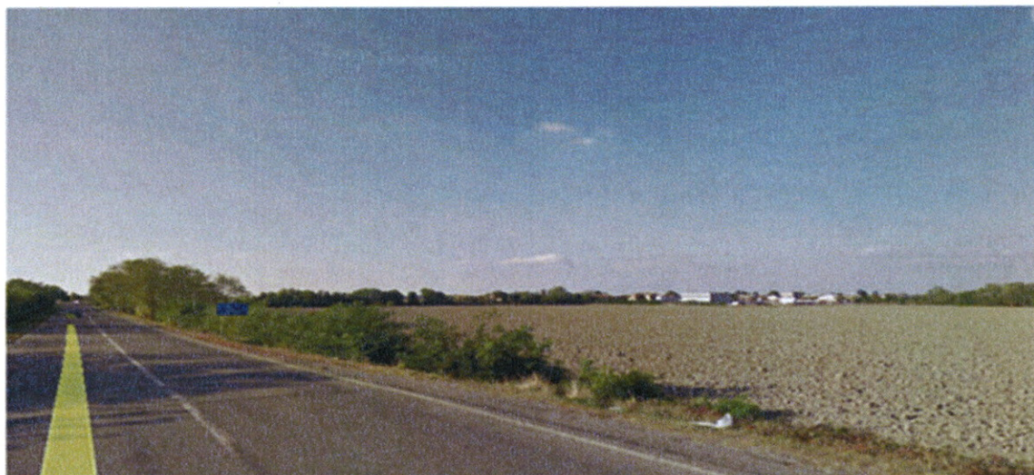
FOTO PANORAMICA DA EST SUD-EST