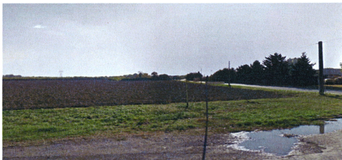
FOTO PANORAMICA DA NORD