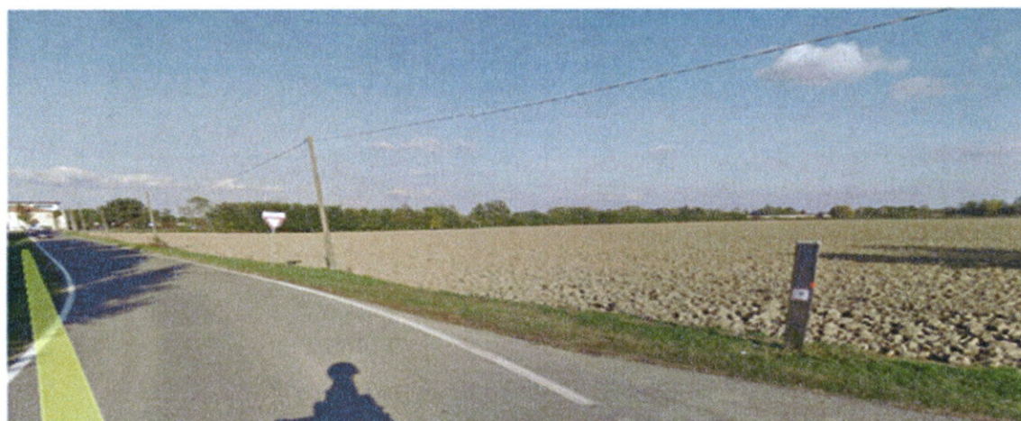
FOTO PANORAMICA DA SUD