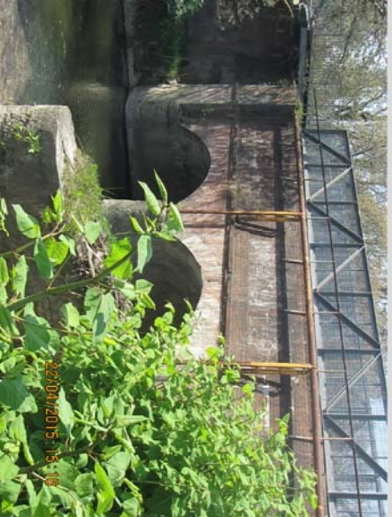
VISTA DEL PONTECANALE VILLORESTI

Scala altezze 1: 100 Scala lunghezze 1: 100