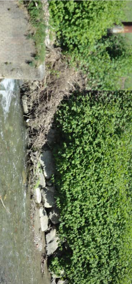
VISTA DEL TRATTO ARGINALE - LATO FIUME