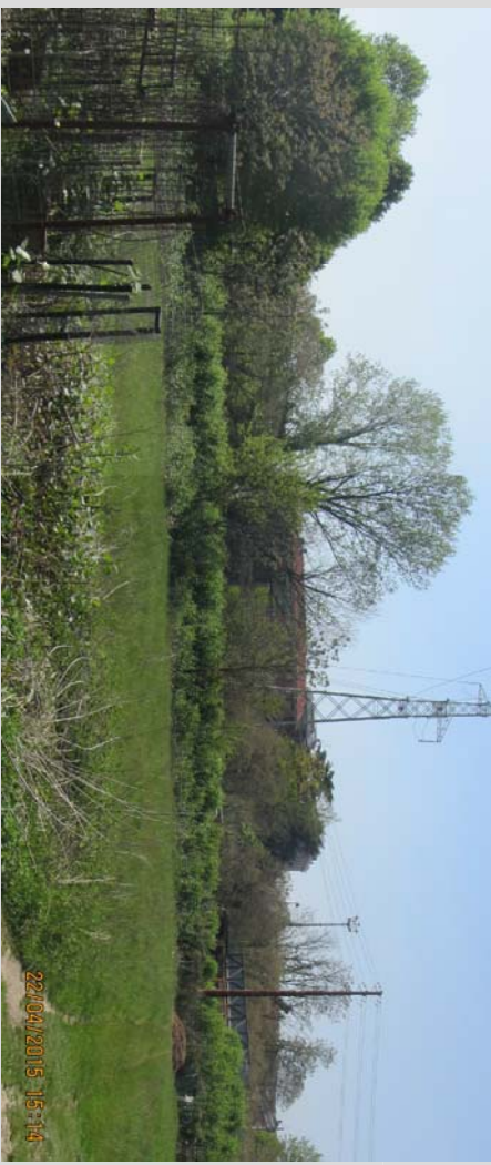
VISTA DEL TRATTO ARGINALE - LATO INTERNO