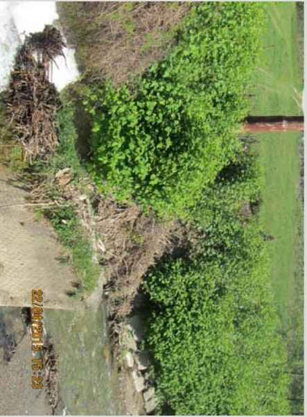
VISTA DEL TRATTO ARGINALE DANNEGGIATO