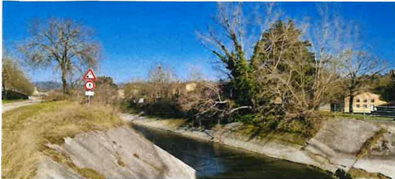
↑ Sinistra idraulica Diversivo di Borghetto

Alberi secchi rischio crollo ciclabile →