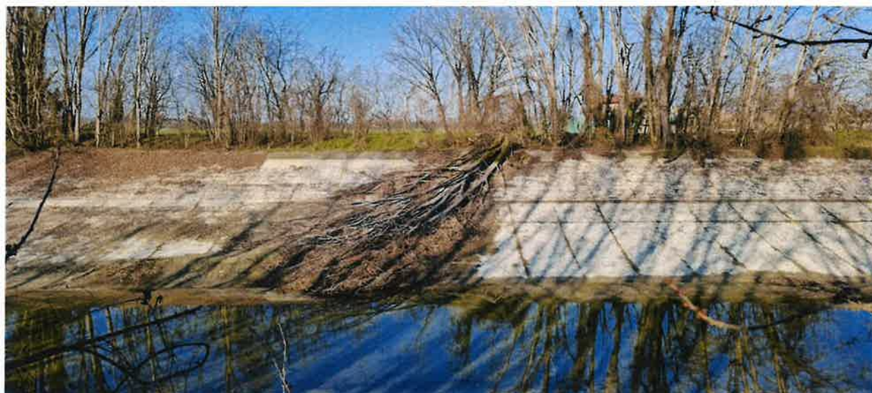
Canale Scaricatore (dx idraulica)