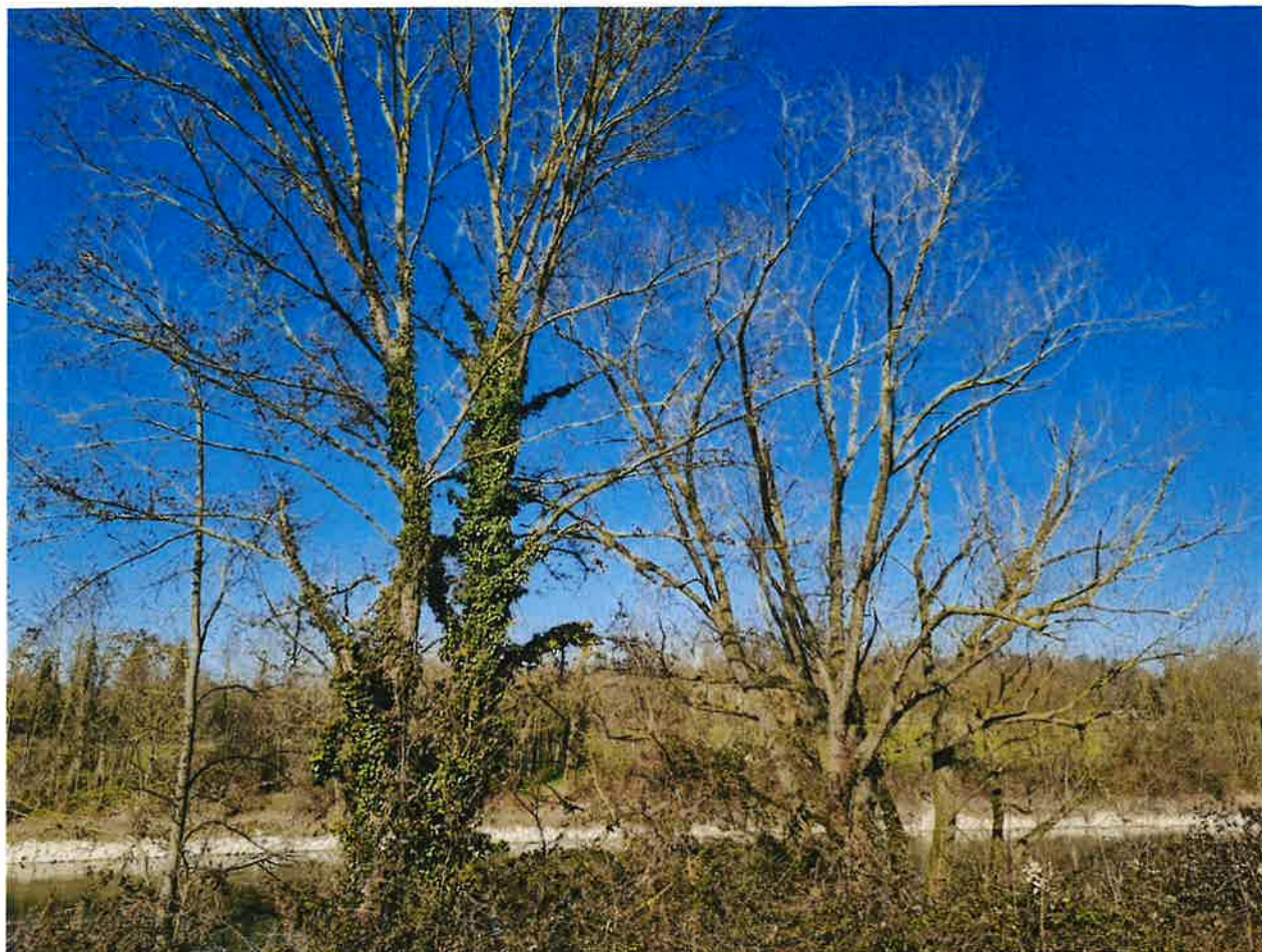
Alberi secchi rischio crollo ciclabile

ACCORDO QUADRO TRIENNALE PER LA MANUTENZIONE ORDINARIA CORSI D'ACQUA E OO.II. DI COMPETENZA PTI N. 1 FIUMI MINCIO, DIVERSIVO E COLLEGATI DALLA DIGA DI SALIONZE ALLA FOCE, CANALE FISSERO, CANAL BIANCO E CANALE ACQUE ALTE.