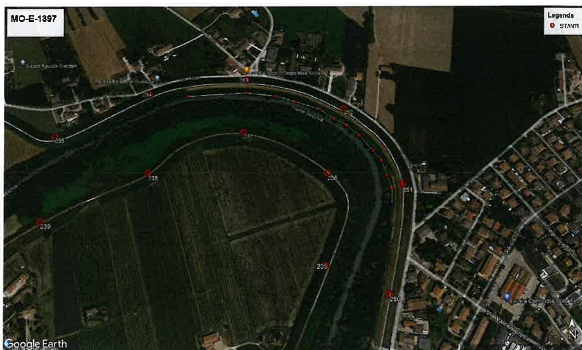
Figura 1 – localizzazione dell’intervento tra gli stanti 250-254 su ortofoto (Comune di Concordia sulla Secchia)

La lunghezza complessiva del tratto oggetto di intervento è pari a circa 450 m. L’intervento in progetto consiste essenzialmente nel consolidamento della struttura arginale che presenta, allo stato attuale, fenomeni di dissesto. Sono previsti anche la realizzazione di dreni perpendicolari all’arginatura e il taglio della vegetazione sulla sponda sinistra con regolarizzazione della scarpata di fronte all’intervento in esame.