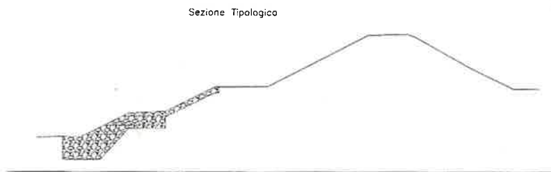
Figura 2 – sezione tipologica intervento di consolidamento arginale nel tratto tra gli stanti 250-254.

Come linee guida per la stesura del progetto, sono stati considerati diversi aspetti, tra cui la tutela del paesaggio delle aree interessate dall'intervento.