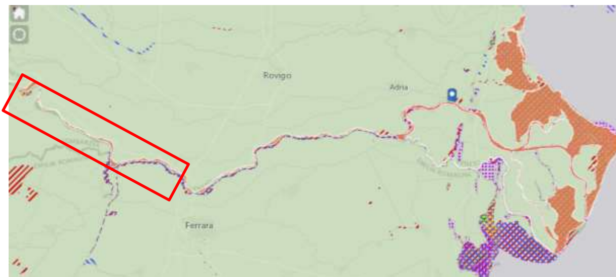
Figura 1. Area di studio con l'indicazione dei siti RN2000 interessati dalla presente VINCA (i due retini colorati che identificano il corso del Po tra Lombardia, Emilia-Romagna e Veneto: il reticolato marrone il sito SIC-ZSC IT 3270017, il reticolo rosso-blu il sito SIC-ZPS IT 4060016); il rettangolo rosso identifica l'area di studio.

Nella presente Valutazione Appropriata, di cui si riporta la SINTESI NON TECNICA, agli elementi della RN2000 potenzialmente soggetti a incidenza significativa (specie floristiche e faunistiche, habitat sensu Direttiva 92/43/CEE), si è deciso di associare altre due matrici ambientali potenzialmente interferite: Acque superficiali (AS) e Suolo e Sedimenti (SE).