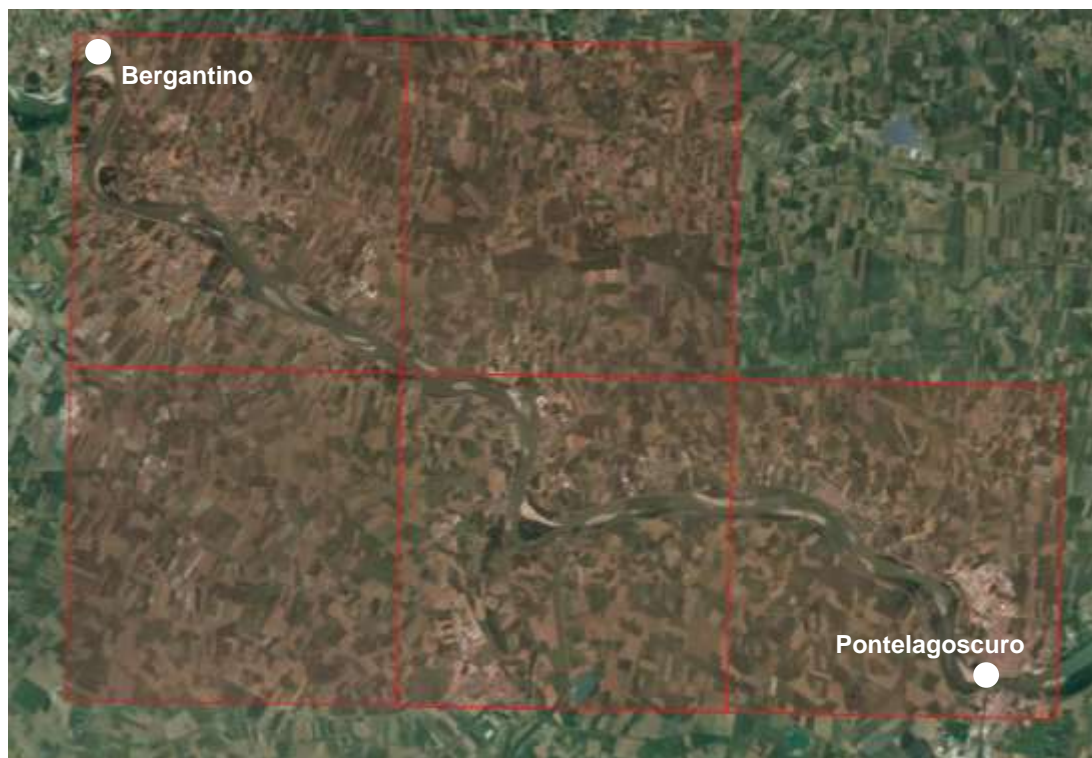
Figura 2. Area di studio = Area Vasta con l'identificazione delle celle 10x10 km utilizzate per l'analisi delle specie di interesse comunitario.

Con particolare riferimento agli habitat di interesse comunitario, sono state indagate solo le patch degli habitat ricadenti nel tratto di Po interessato dalle opere (nel segmento Castelmassa-Ferrara), per la componente animale sono state analizzate, invece, tutte le specie riconosciute all'interno delle celle 10x10 km che includono l'area di studio (figura 2).