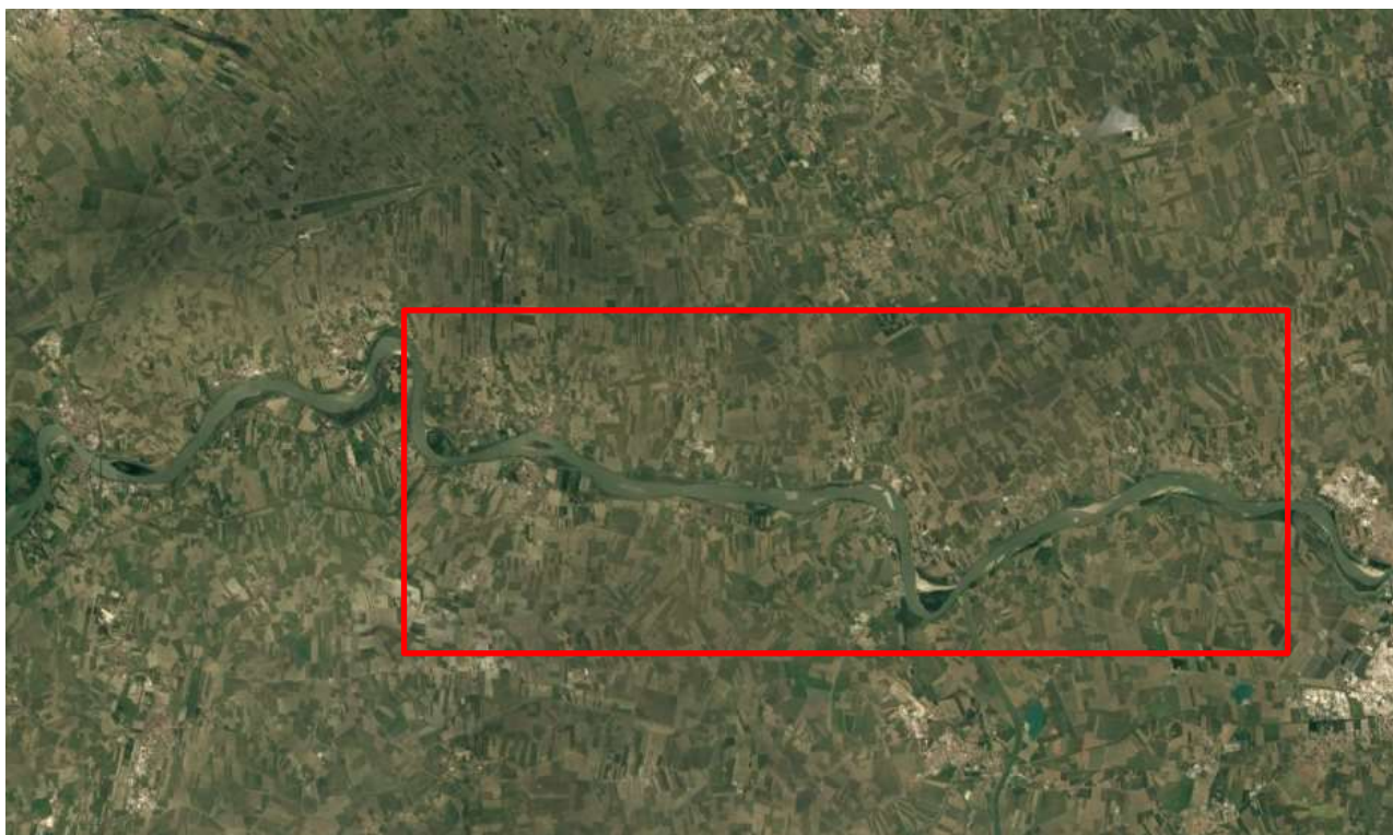
Figura 1. Ambito territoriale oggetto di intervento (nel riquadro rosso).

Gli interventi di progetto riguardano aree ricomprese all'interno degli argini maestri del fiume Po, nell'ambito di tre differenti regioni, ovvero Lombardia, Veneto ed Emilia-Romagna (Figura 1).