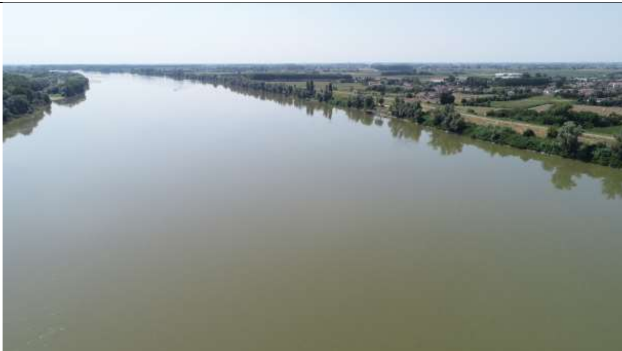
Figura 18 – Stato attuale – vista con portata pari o inferiore a 800 m 3 /s ( circa 85 giorni all'anno )