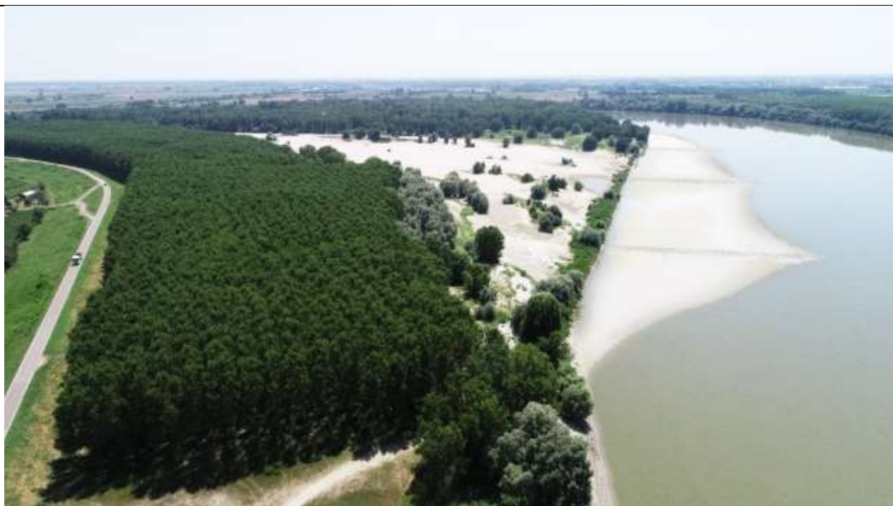
Figura 14 – Scenario evolutivo a lungo termine – Vista del fiume con portata inferiore a 800 m 3 /s