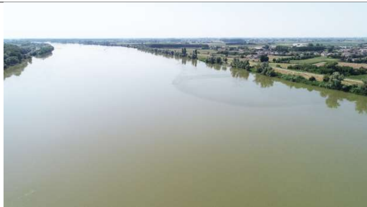
Figura 21 – Stato attuale e scenario evolutivo – Vista del fiume con portata superiore a 800 m 3 /s