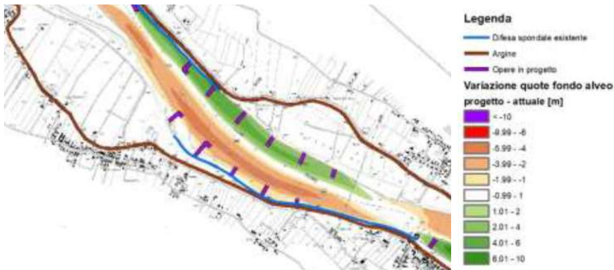
Figura 5 – Tendenza media del fondo alveo in seguito alla realizzazione delle opere

Sulla base di quanto sopra esposto, quindi, lo scenario evolutivo connesso al presente intervento prevede l'asportazione del materiale sabbioso depositato al centro del fiume e la localizzazione di esso lungo le due sponde ove sono presenti i pennelli in progetto.