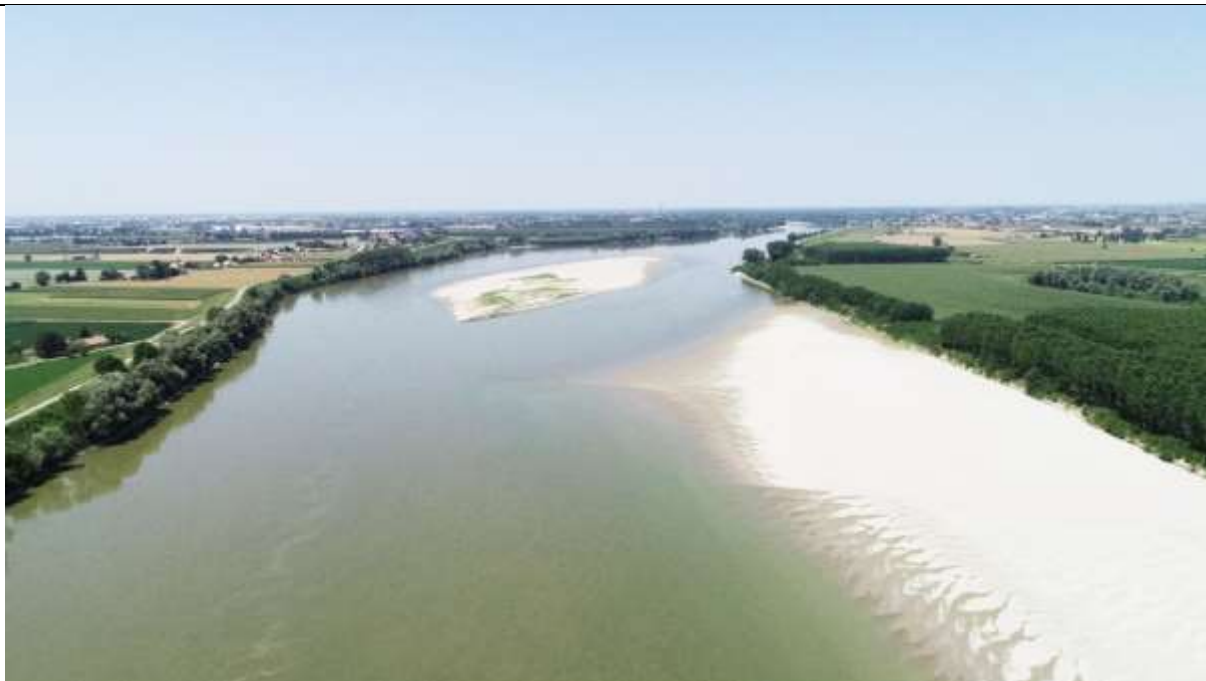
Figura 6 – Stato attuale – vista con portata pari o inferiore a 800 \text{ m}^3/\text{s} ( circa 85 giorni all'anno )