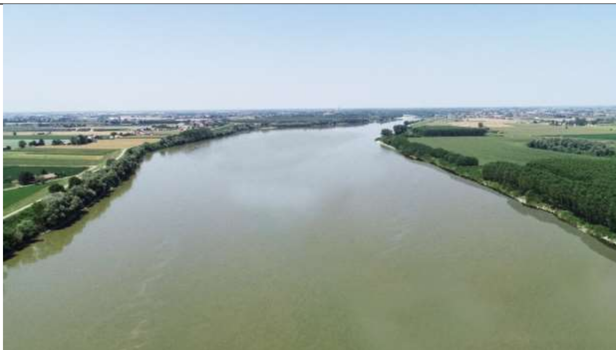
Figura 9 – Stato attuale e scenario evolutivo – Vista del fiume con portata superiore a 800 m 3 /s