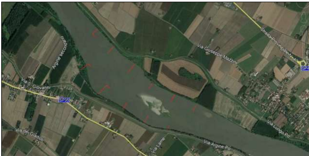
Figura 4 - Schema progettuale dei pennelli previsti nell'intervento n°3

L'intervento numero 3 prevede, in seguito al completamento degli interventi previsti (oltre allo stralcio funzionale), la realizzazione di 9 pennelli di tipo trasversale in modo da concentrare la corrente di magra al centro dell'alveo di magra, come visibile nel seguente estratto planimetrico.