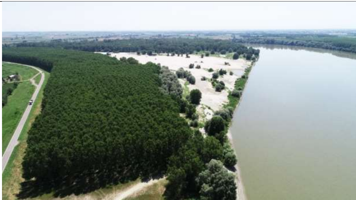
Figura 12 – Stato attuale – vista con portata pari o inferiore a 800 m 3 /s ( circa 85 giorni all'anno )