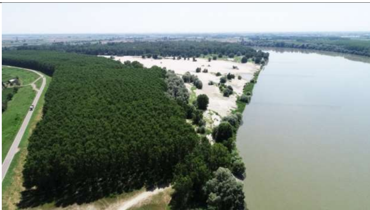
Figura 15 – Stato attuale e scenario evolutivo – Vista del fiume con portata superiore a 800 m 3 /s