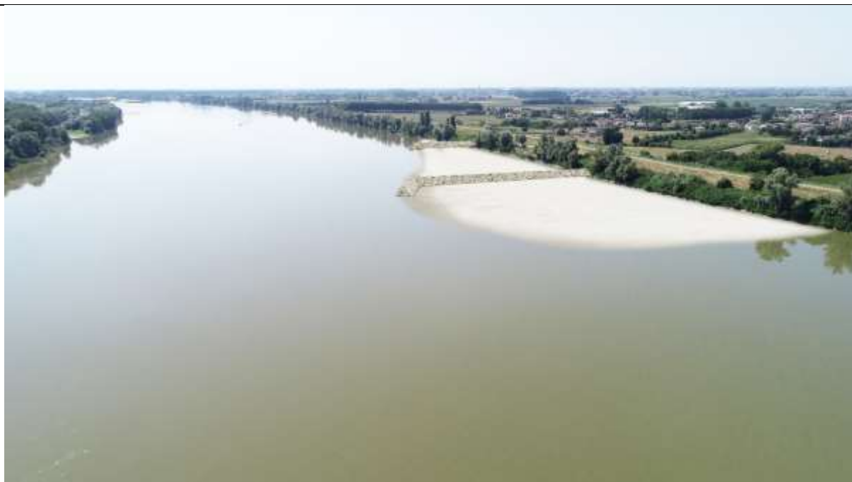
Figura 19 – Scenario evolutivo a breve termine – primi anni seguenti alla realizzazione - vista in seguito per portate inferiori a 800 m 3 /s ( circa 85 giorni all'anno )