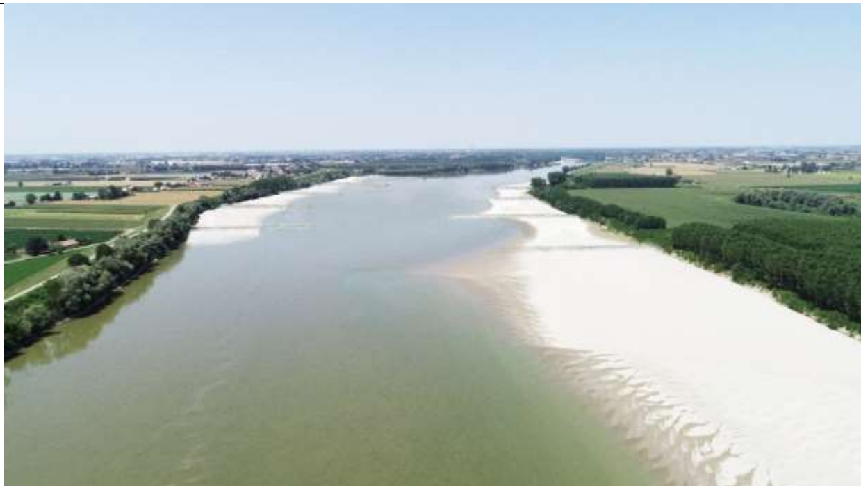
Figura 8 – Scenario evolutivo a lungo termine – Vista del fiume con portata inferiore a 800 m 3 /s