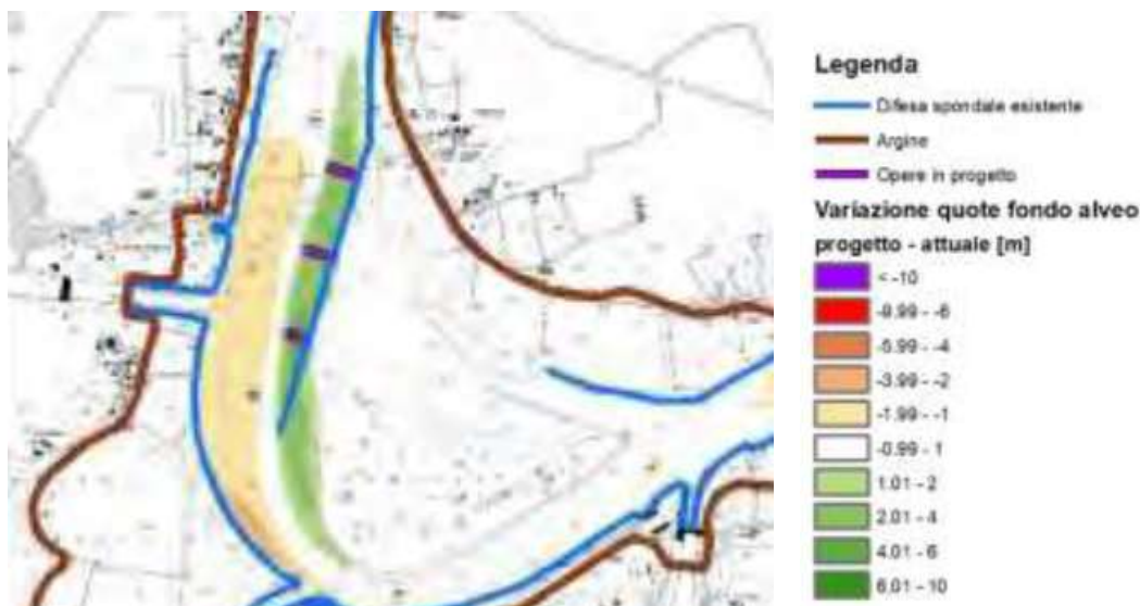
Figura 11 – Tendenza media del fondo alveo in seguito alla realizzazione delle opere

Sulla base di quanto sopra esposto, quindi, lo scenario evolutivo connesso al presente intervento prevede l'asportazione del materiale sabbioso depositato al centro del fiume e la localizzazione di esso lungo la sponda di ubicazione dei nuovi pennelli.