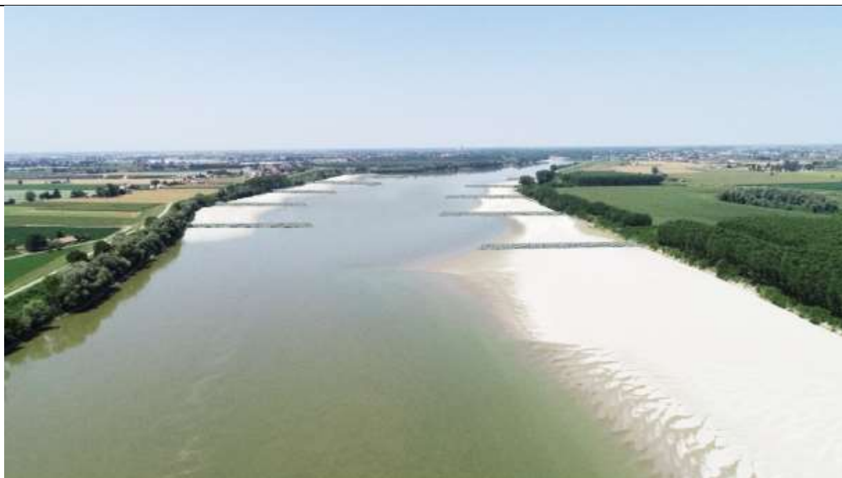
Figura 7 – Scenario evolutivo a breve termine – primi anni seguenti alla realizzazione - vista in seguito per portate inferiori a 800 \text{ m}^3/\text{s} ( circa 85 giorni all'anno )