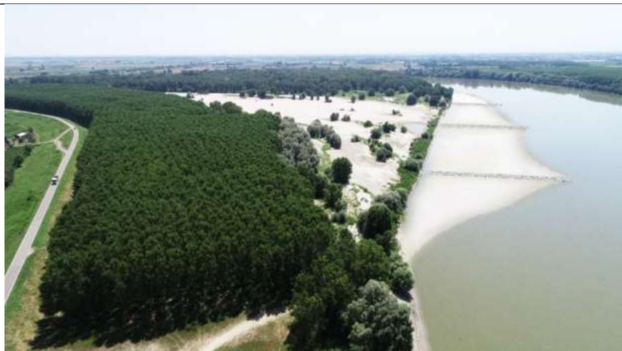
Figura 13 – Scenario evolutivo a breve termine – primi anni seguenti alla realizzazione - vista in seguito per portate inferiori a 800 m 3 /s ( circa 85 giorni all'anno )