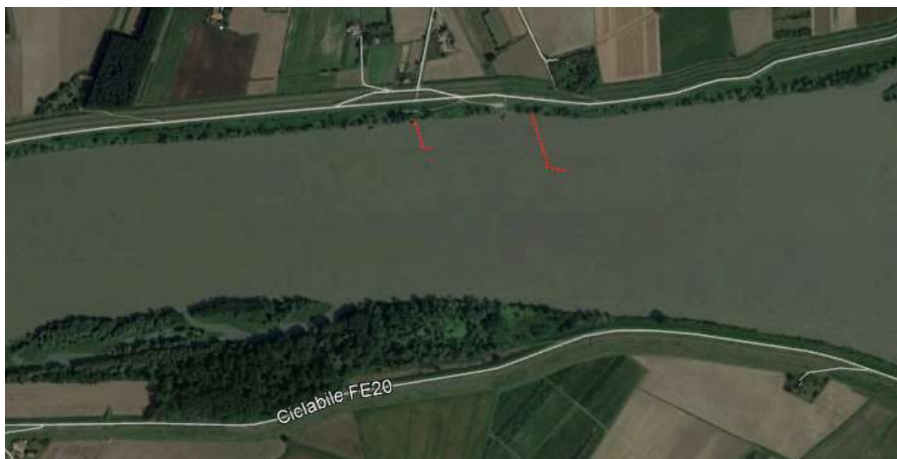
Figura 16 - Schema progettuale dei pennelli previsti nell'intervento n°10

Le opere previste si attestano in corrispondenza della sponda in sinistra idraulica, sviluppandosi verso la sponda opposta.