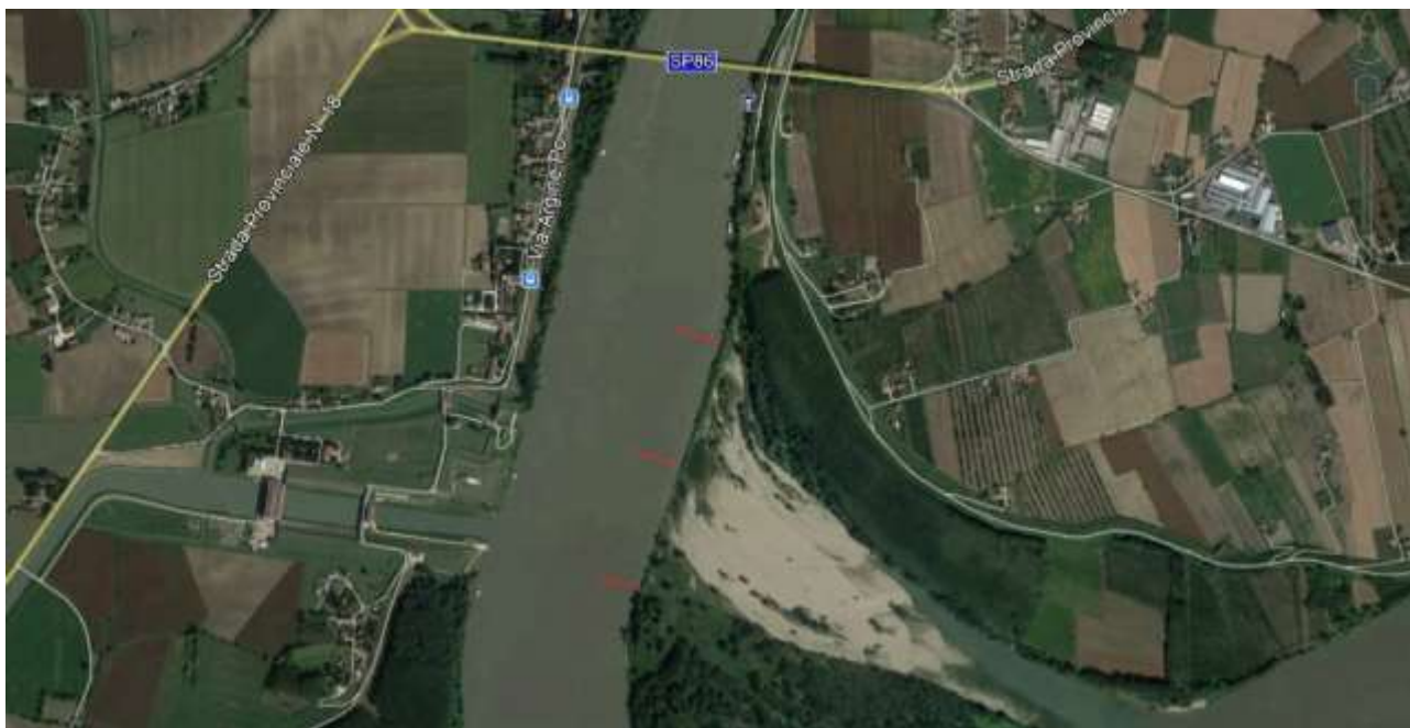
Figura 10 - Schema progettuale dei pennelli previsti nell'intervento n°8

In relazione alla lanca qui visibile, l'ubicazione dei nuovi pennelli non ne pregiudica in alcun modo il funzionamento; infatti, i pennelli di nuova realizzazione sono previsti con quota sommitale pari alla portata di 800 m 3 /s mentre la difesa sponale longitudinale su cui si attestano presenta quota sommitale corrispondente a portate dell'ordine dei 4000 m 3 /s.