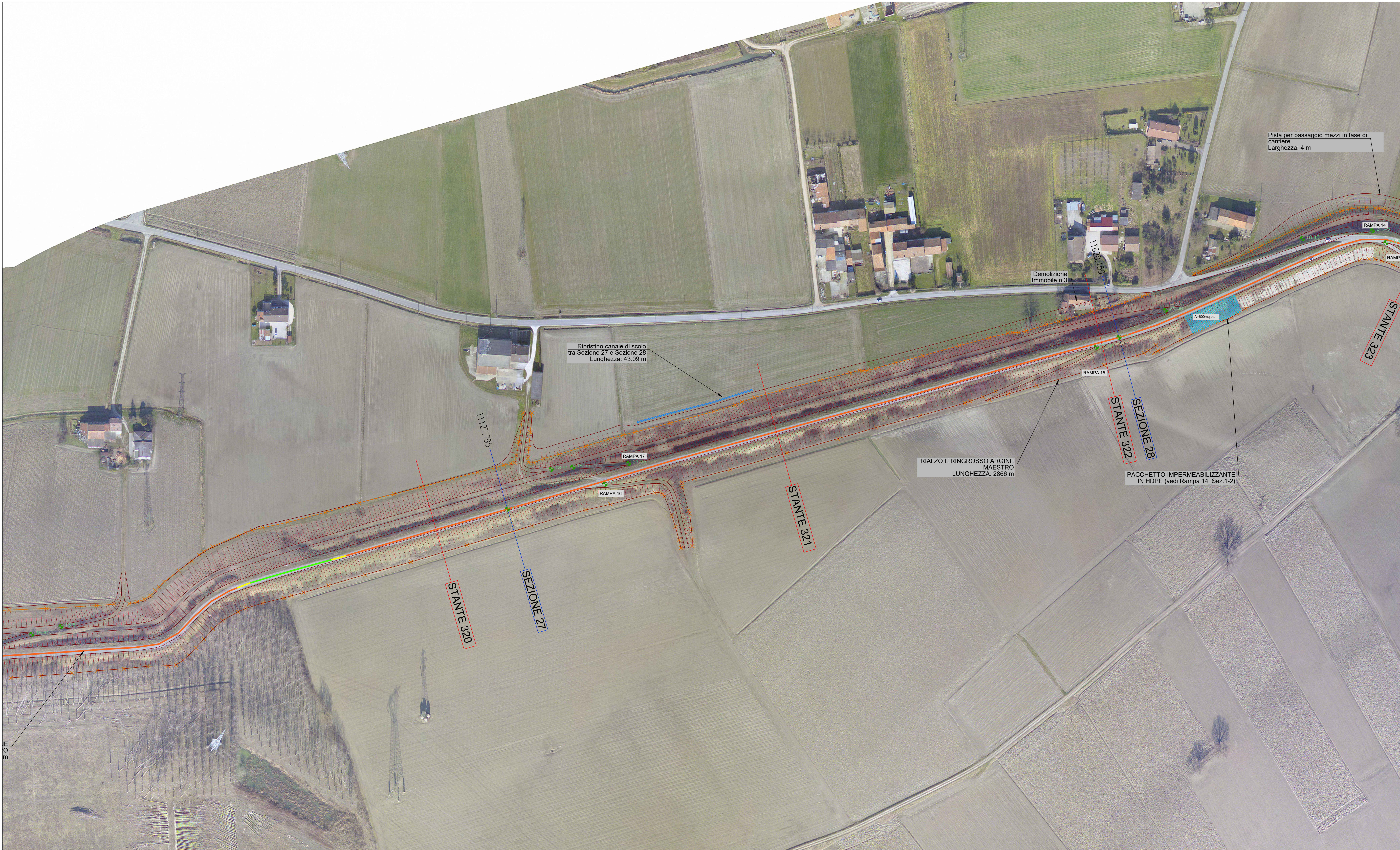
RIQUADRO B - SCALA 1:1.000