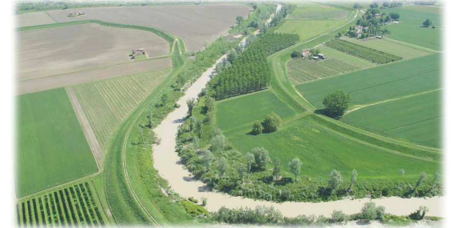
Progetto esecutivo II° stralcio - I° lotto

Adeguamento strutturale e funzionale del sistema arginale difensivo tramite interventi di adeguamento in quota ed in sagoma a valle della cassa fino al confine regionale per garantire il franco di 1 metro, rispetto alla piena di TR 20 anni nello stato attuale, e la stabilità e resistenza dei rilevati (MO-E-1323)